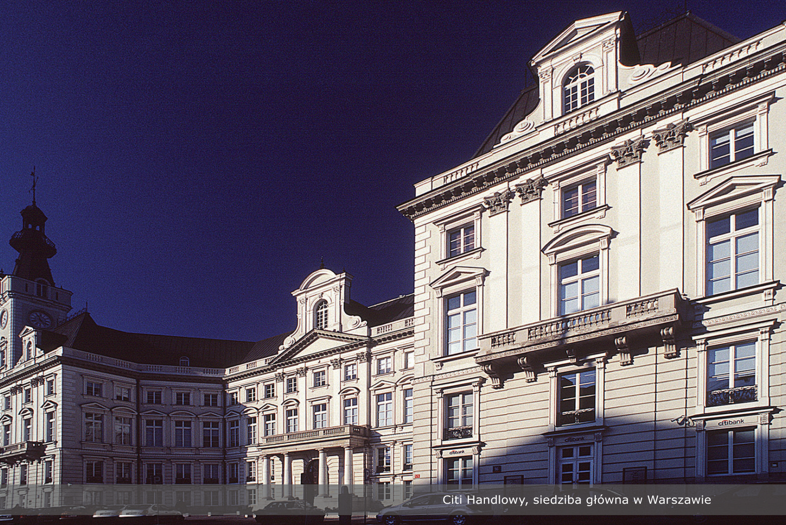
Citi Handlowy, siedziba główna w Warszawie

Citi Handlowy, łączący doświadczenie i najlepsze tradycje polskiej bankowości z nowoczesnym sposobem prowadzenia finansów, jest w Polsce jedną z największych instytucji finansowych świadczących usługi w zakresie bankowości korporacyjnej, inwestycyjnej i detalicznej.